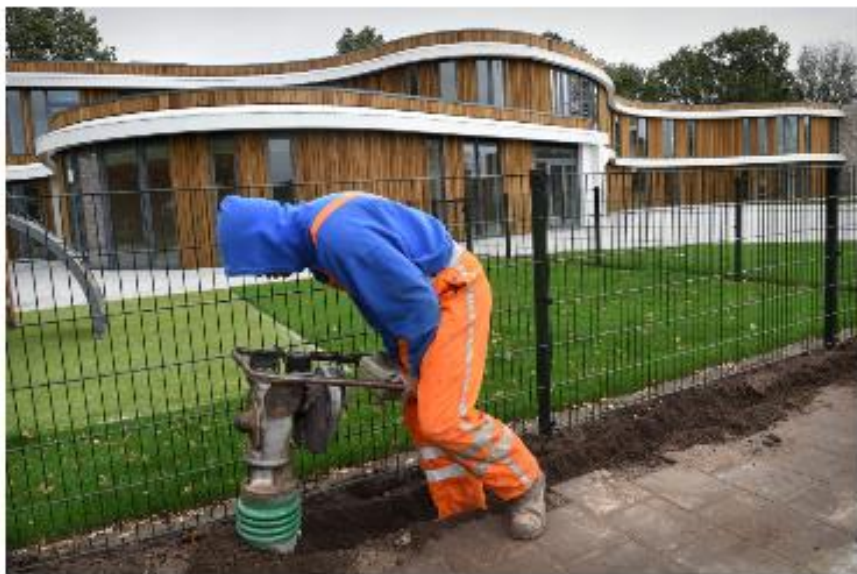
De brede school in Hoeven. De trend dat steeds meer aanbestedingen mislukken is vooral zichtbaar bij scholenprojecten.